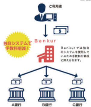
ロゴ・送金代行サービススキーム